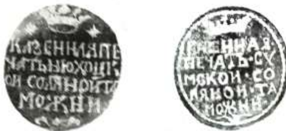
Казенные печати Сумской и Ньюхоцкой соляных таможен. Март 1797 г. НА РК.